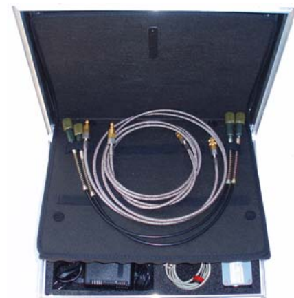
Hydraulik- und SF6 Gasschläuche im Deckel