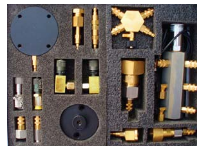
Adapter und Fittinge im Bodenteil

Typische Arbeiten die mit dem PDT3 Mess-System einfach erledigt werden: